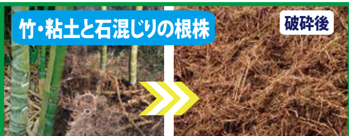
竹・粘土と石混じりの根株